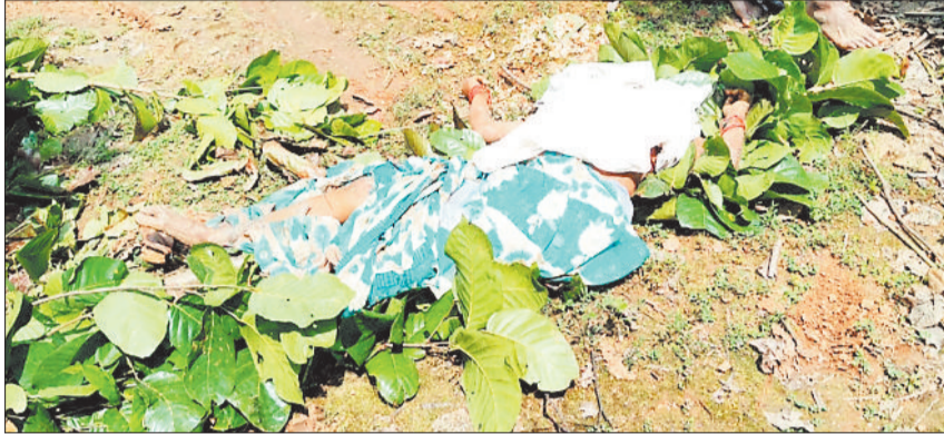
जंगल में पड़ी महिला की लाश।

में उठाकर पटक दिया, जिससे उनकी मौत के ही दर्दनाक मौत हो गई। वहीं कमला बाई पति दिलसाय घायल हो गई, जिनका घर पर इलाज चल रहा है। इस बीच एक महिला ने गड्डे में छिपकर अपनी जान बचाई तो एक अन्य महिला को भी हल्की चोट आई।