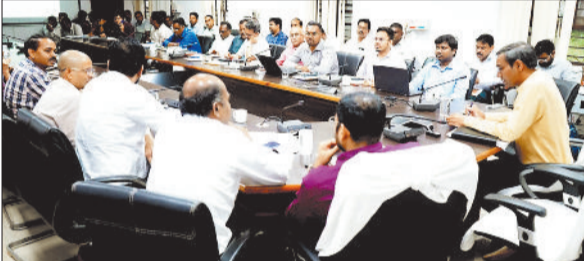
अधिकारियों-कर्मचारियों की बैठक लेते सहायक कलेक्टर।

इस अवसर पर समयमान, वेतनमान एवं पेंशन के संबंधित प्रकरणों की समीक्षा करते हुए इनका जल्द से जल्द निराकरण करने हेतु निर्देश दिए गए। मुख्यमंत्री जनदर्शन, सीएमटीएल, पीएनजी पोर्टल, कलेक्टर जनदर्शन, जनशिकायत के प्रकरणों पर प्रकरणवार चर्चा करते हुए सभी प्रकरणों को समय सीमा के भीतर निराकरण करने को कहा गया। इस अवसर पर सभी विभागों के