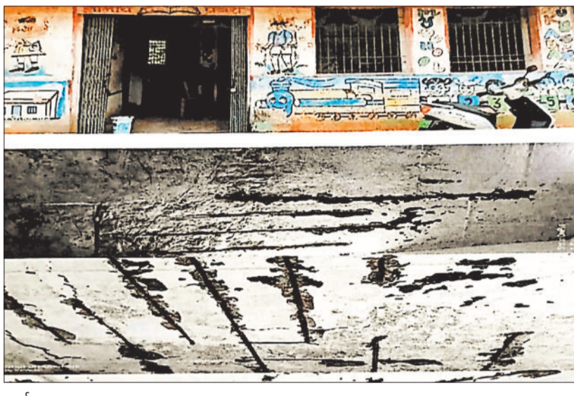
जर्जर स्कूल भवन।

जानकारी के अनुसार पथलगांव विकासखण्ड की ग्राम पंचायत रोकबहार के शासकीय प्राथमिक शाला सुकबासुपारा शाला के शिक्षकों ने स्कूल गेट पर सूचना चस्पा कर बताया है कि उक्त भवन अति जर्जर होने के कारण छात्रसुरक्षा एवं छात्रहित को ध्यान में रखते हुये इस शाला का संचालन शासकीय प्राथमिक शाला रोकबहार शाला में किया जा रहा है। सूचना में उन्होंने उल्लेख किया है कि शाला अति जर्जर अवस्था में होने के कारण