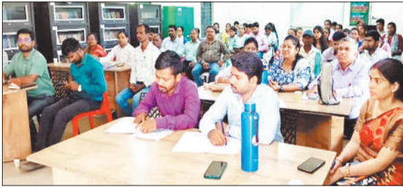
बैठक में शामिल विज्ञान सहायक।