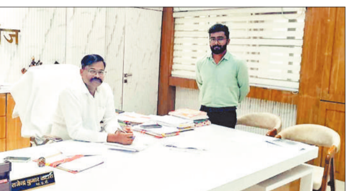
कलेक्टर को ज्ञापन सौंपता युवक।

जिला अस्पताल एवं रामानुजगंज 100 बिस्तरिय अस्पताल में हर रोज नगर सहित आसपास क्षेत्र से हर रोज बड़ी संख्या में पॉइंट बन्दी संख्या में ग्रामीण उपचार कराने पहुंचते हैं। अस्पताल में गंभीर मरीजों का प्राथमिक उपचार कर रेफर किया जाता है लेकिन कई मरीज ऐसे होते हैं जिसका उपचार अस्पताल में ही हो सकता है लेकिन अस्पताल में सुविधा के अभाव में परिजन निजी या मेडिकल कॉलेज अस्पताल के अलावा रायपुर या बिलासपुर अस्पताल ले जाने को मजबूर है। जिले में